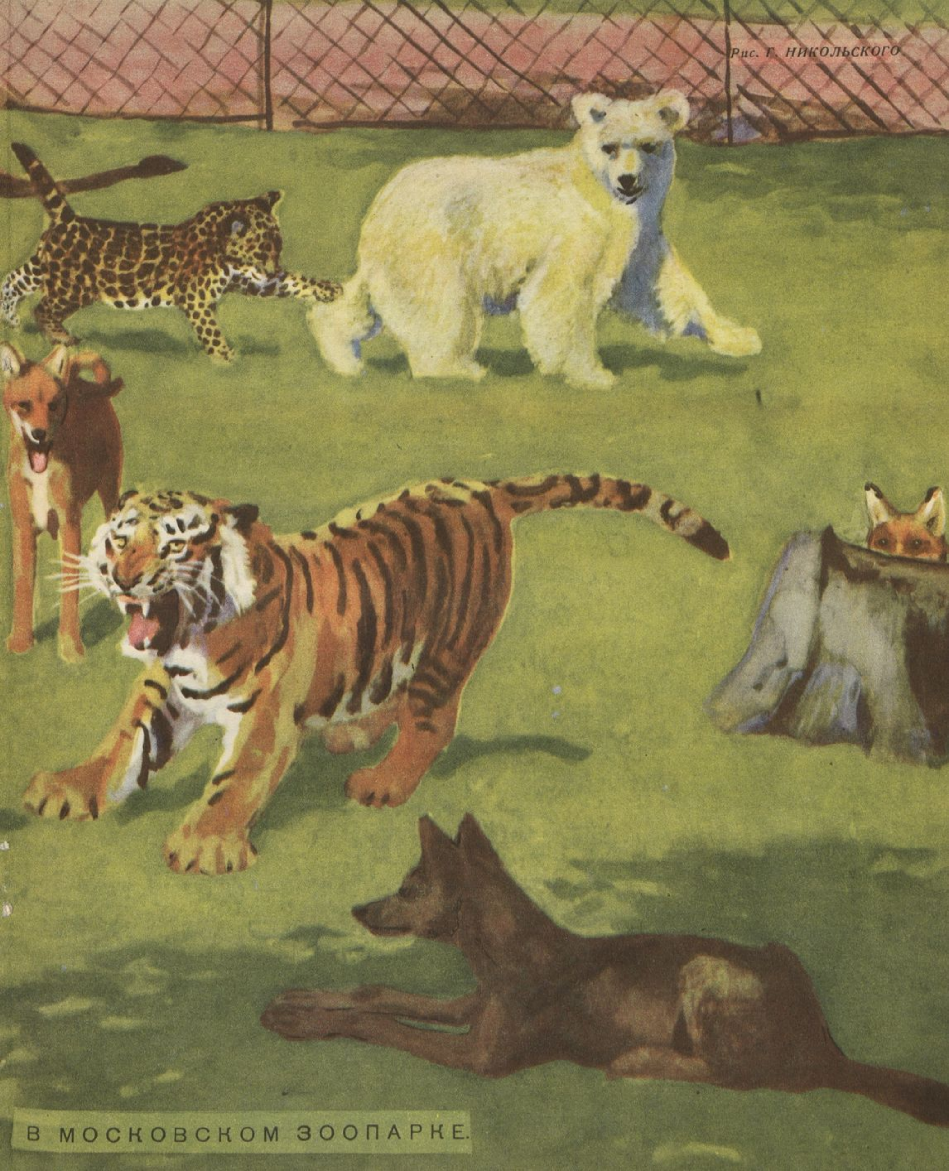
Рис. Г. НИКОЛЬСКОГО