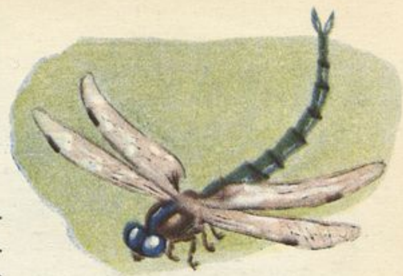
Рис. В. АНДРИЕВИЧА

лись таинственными золотыми глыбами. Красные полавки медленно сносило течением в сторону, а мы с Ромкой сидели на берегу и ждали, когда клюнет какая-нибудь рыба.